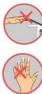
Illustration : www.hegasy.de